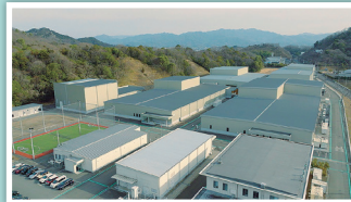
マグミット製薬本社工場