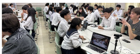
コロラド州立大生 と生徒との意見交 換