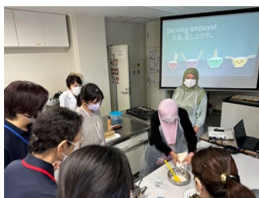
調理実習の様子（アンバヤット（左）、わらび餅（右））