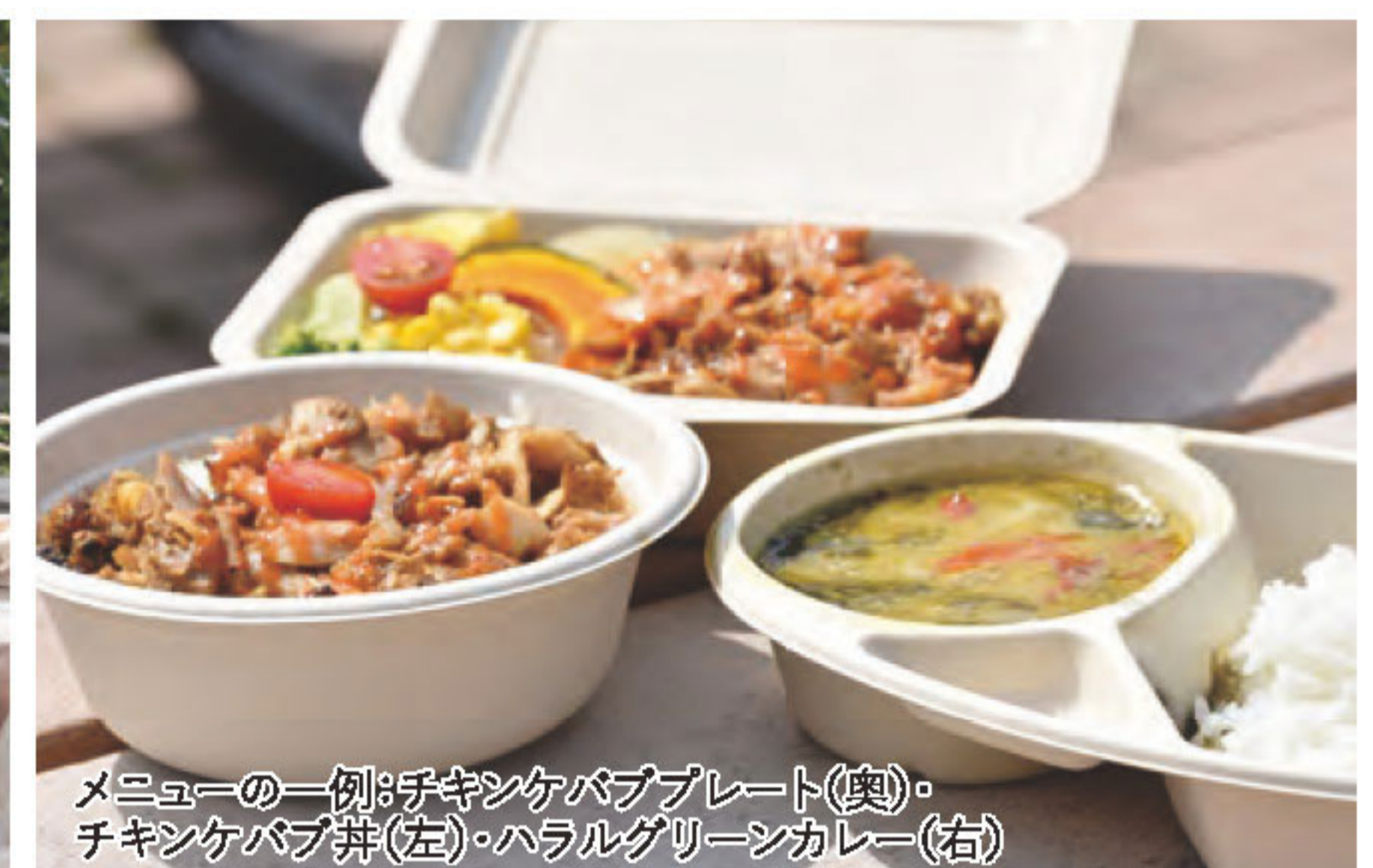
メニューの一例:チキンケbabプレート(奥) チキンケbab丼(左)・ハラールグリーンカレー(右)