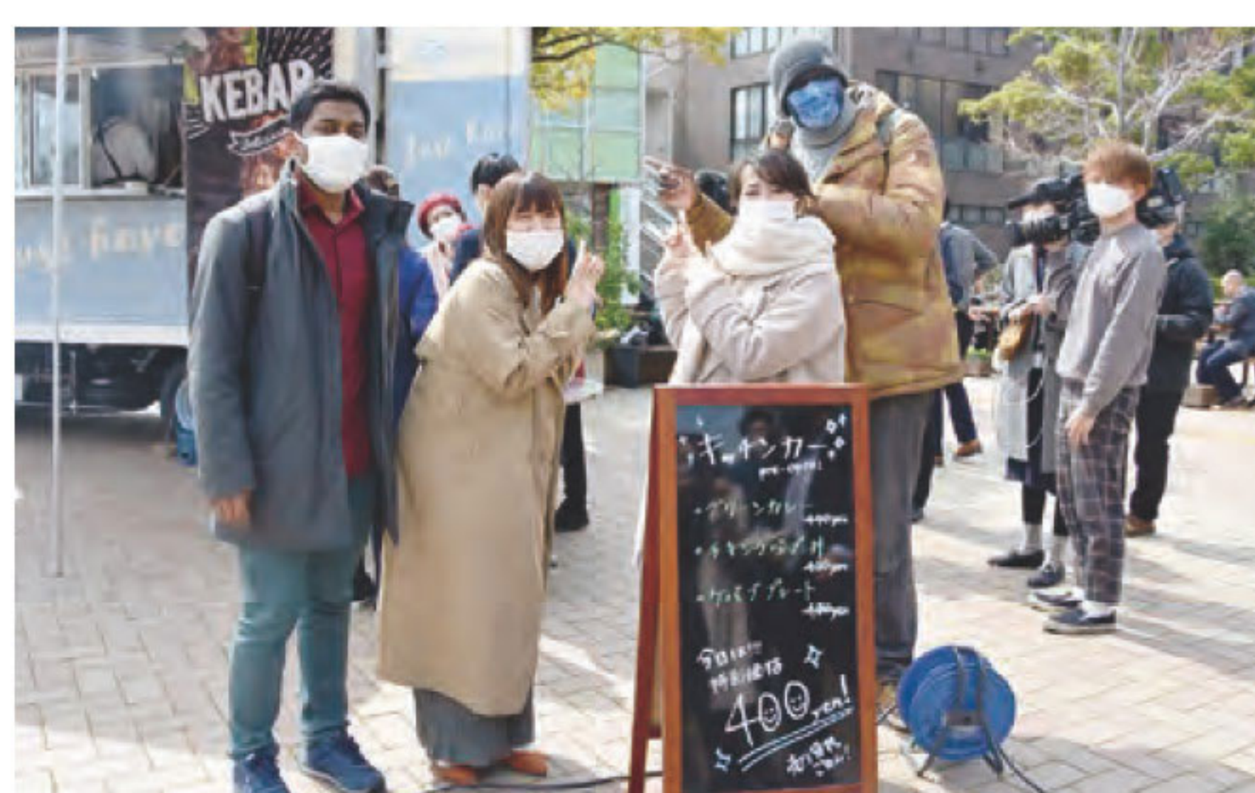
プレオープン当日の様子

留学生にとっても安心して利用でき、移動販売なので誰にでも気軽に楽しんでもらえることで、多くの人に知ってもらえるきっかけとなれば嬉しいです。