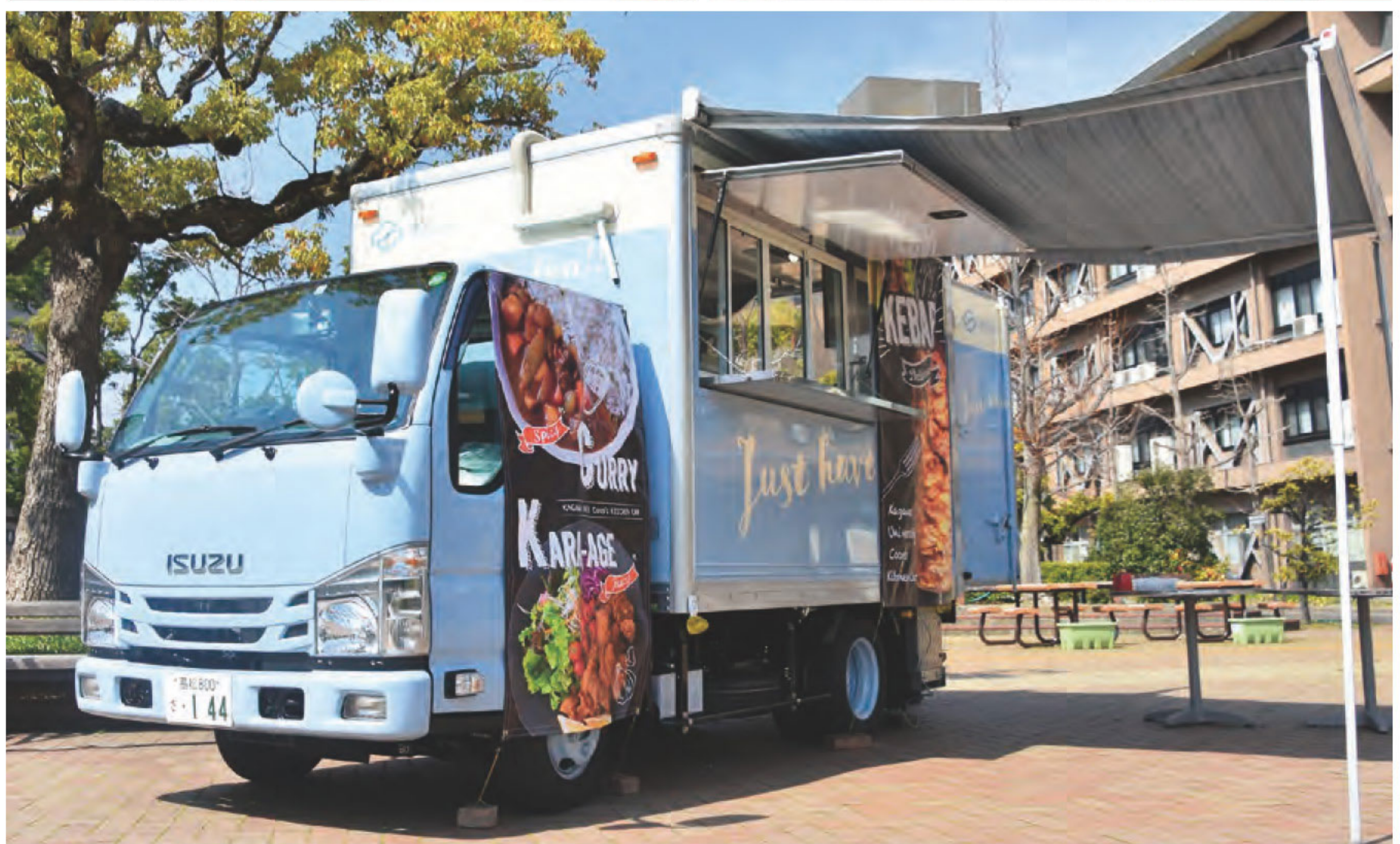
ハラール食限定のキッチンカー

上げメンバーの一人としてFacebookでの広報活動や食堂でのムスリムフレンドリーメニューの提供、醤油持込OKの香川県内のうどんMapの作成などを行ってきました。