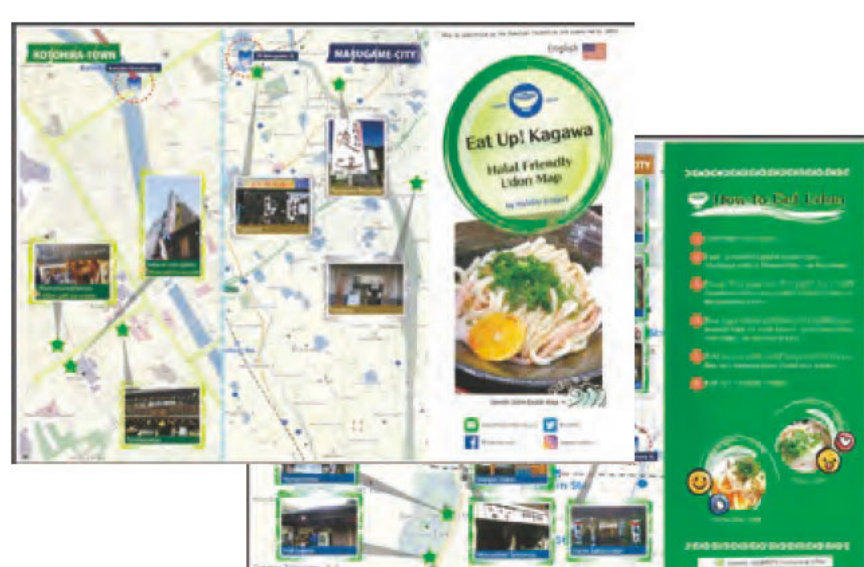
Halalisi Projectが作成したうどんMap