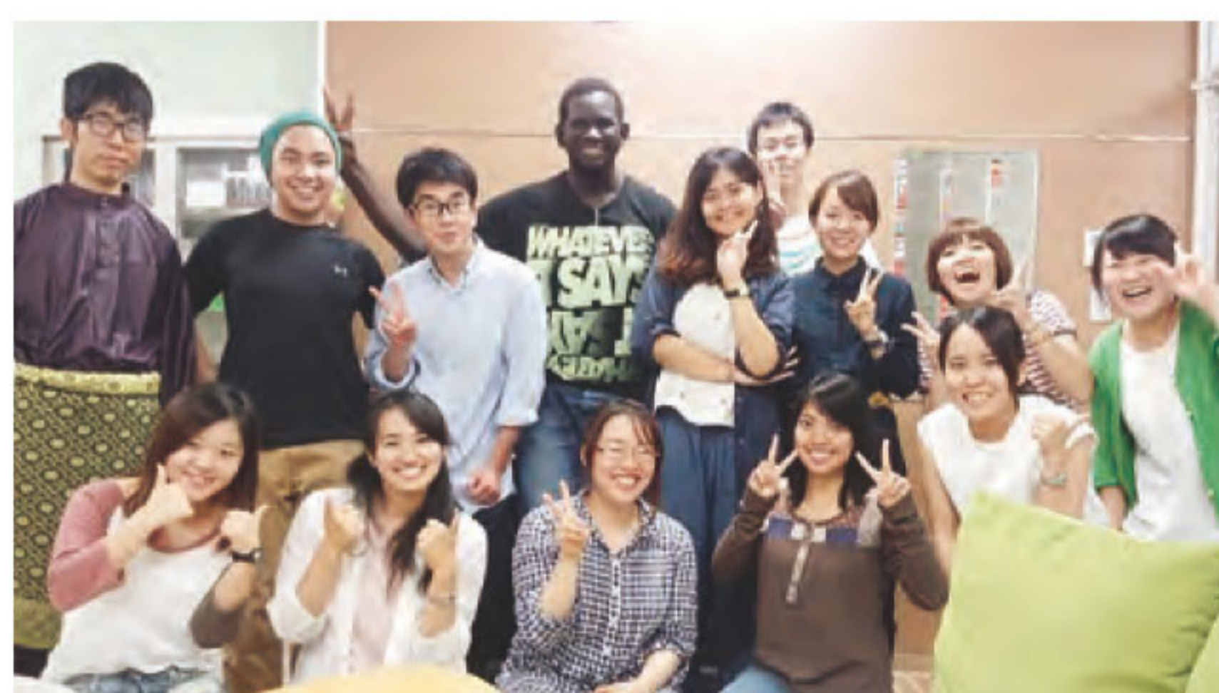
Halalisi Projectの初期立ち上げメンバー集合写真

例えば、ムスリムの学生は、豚肉やアルコールが含まれている料理は食べることができません。実は多くの日本料理には酒や酒が含まれている調味料(みりん、だし醤油等)が使われており、食べられる料理を見つけることは容易ではありません。日本語を母国語としない彼らにとってそれは、さらにハードルの高いことでした。彼らと付き合ううちに、もっと気軽に食事が楽しめれば良いと思うようになりました。そのためには、留学生と直接関わる学生だけではなく、他の学生や地域の方々にも、食の制限のことについて知ってもらふ必要があると思い、4年前からHalalisi Projectというプロジェクトの立ち