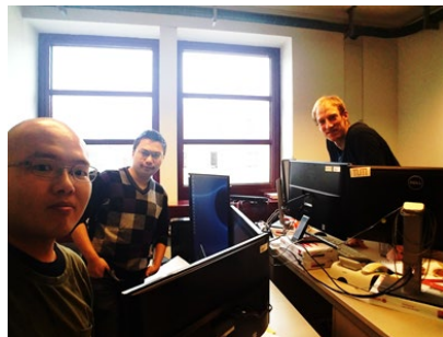
3人で1部屋の研究室を使用