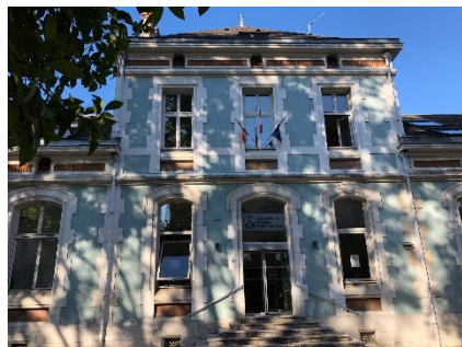
シャンベリーキャンパス本部