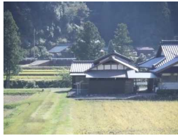
文化的景観（松野町）

近年の歴史的建造物に関わる動きとして、建造物単体だけではなく、歴史的な町並み景観や、文化的な集落景観の視点から、まちづくりとして保存活用を目指す動きが活発化しています。四国で注目されている魅力的な建造物や景観の事例をご紹介します。