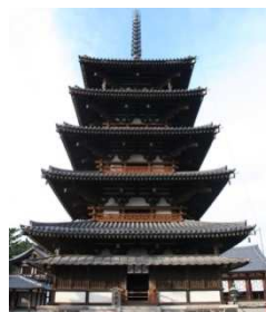
国宝 法隆寺五重塔

神社や寺に代表される日本の歴史的建造物は、地域のシンボルとして大切に受け継がれてきました。近年では観光資源としても活用されており、地域の活性化に貢献しています。講義では、このような歴史的建造物の修復方法や活用方法とともに、地震や台風などの自然災害から建物を守る技術について紹介します。