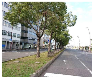
高松市街地の街路樹

街路樹、植え込みなどの「まちのなかのみどり」は、枝葉の伸長・落葉落枝による交通支障や、雑草・虫などの発生を理由として邪魔者扱いされがちです。「みどり」は私たちに様々な恩恵(=多面的機能)をもたらしてくれるのですが、どのような機能がどのくらいあるのか、見えにくいのが邪魔者扱いされる一因ではないかと考えています。こうした「緑の多面的機能」とその評価の試みについて紹介します。