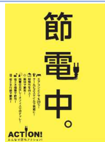
節電ポスター

省エネルギー(以下省エネ)の推進は今後ますます必要となりますが、何も我慢することだけが省エネという訳ではありません。省エネとはそもそも何か、どうして必要となったのか、様々な省エネルギーの取り組みによってどの程度の効果が期待できるのか、省エネ行動は周辺にどのような影響を与えるのか…。これらの事柄について、私が専門とするエネルギー需給、温熱環境の点から考えてみたいと思います。