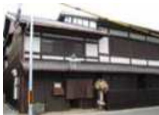
民家を転用した高齢者の小規模多機能ホーム

少子高齢化により福祉、医療などへの対策が重要な課題となっています。環境のあり方を工夫して多くの人々が不自由なく生活できるようにすることがユニバーサルデザインと言われていています。すべての人が安心して快適に暮らせることを目指す福祉の視点からユーザー本位の施設づくりやまちづくりについて調査事例をもとに紹介します。