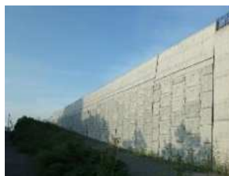
土でつくられた社会基盤構造物の例（補強土壁）

土は我々が生活する地盤を構成しているのみならず、古くから様々な構造物の材料として利用されてきました。現代社会においても、様々な技術・知見を取り入れながら、数多くの社会基盤構造物が土でつくられています。本講義では、土でつくられた社会基盤構造物を対象として、その種類や役割、用いられている技術について、安定や変形といった力学的性能を踏まえながら学びます。