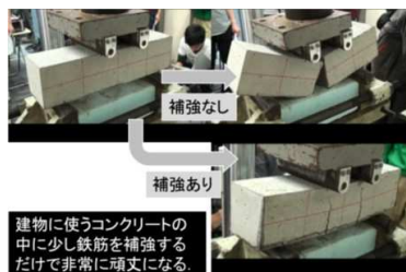
コンクリート部材の耐荷力試験

四国においても、他の地域と同様に地震による被害が予想されます。建物の中に居住している人間が、地震時であっても無事であるためには、建物が頑丈であり、この頑丈さが長続きしなくてはなりません。この講義では、頑丈で長持ちする建物のつくりかたについて学びます。