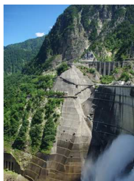
水力発電(黒部ダム)

世界的にも注目されている地球温暖化ですが、我々は何をするべきなのでしょう。再生可能エネルギーの推進や電気自動車の普及など、国レベルでの対策が求められています。地球温暖化のような不確実な現象に対して、我々がとるべき対策を考えるためには「確率」に対する考え方がとても重要になります。本講義では、不確実な事象のとらえ方を考えるとともに、地球温暖化の影響やその対策について紹介します。