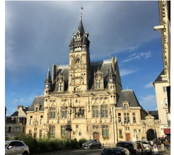
City hall of Compiègne