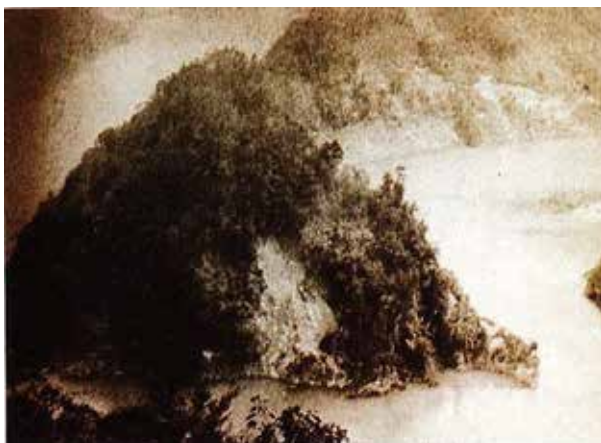
写真4 天然ダム決壊直後の出合の状況