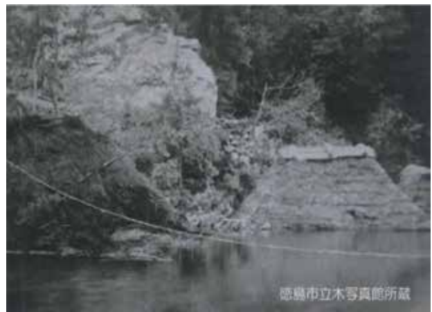
写真3 高磯山の崩壊上流の被害状況