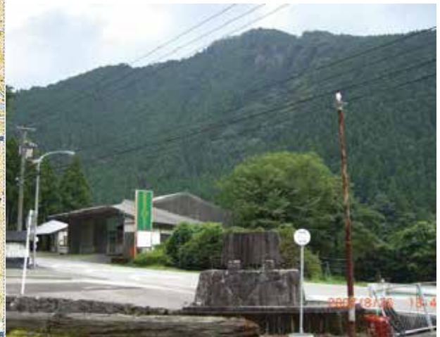
写真 1 高磯山を背景にした慰霊碑 (2007 年撮影)

明治 25 年 7 月 25 日に発生した高磯山の大崩壊は、 図 2 の絵図のように言語を絶するもので、阿南市桑野町西崎文庫蔵書「諸県変シ全」によると「山崩れは幅 300 余間、高さ 400 間（540～720m）あり、崩壊に際し、対岸（那賀郡分）人家 17～18 戸は空中に飛散し去り、数十余間の外に落ちたりと言ふり。」ある。また、山崩れにより堰止められた那賀川は、その高さ百数十間に達し、同 27 日に発生した決壊により沿岸数十里に渉る樹石田面を洗い去りつつ、一直線に奔下したと記されている。