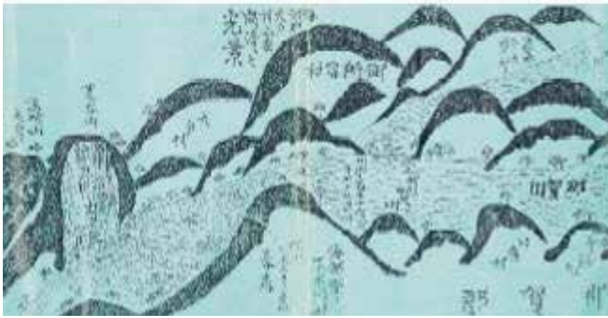
図2 高磯山大崩壊の様子を描いた絵図

絵図の左側が下流、高磯山の崩壊場所は、那賀川が崩壊土砂で河道閉塞され下流には水がほとんど流れていない状況や上流はダムようになって洪水を貯めている様子が描かれている