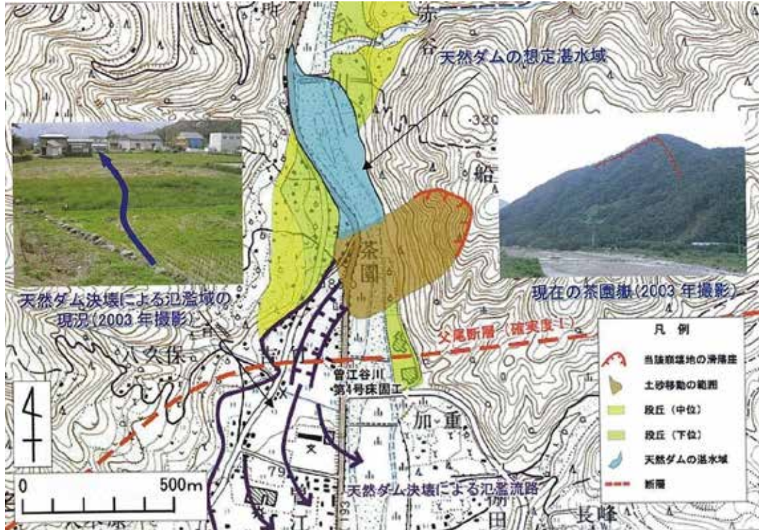
図1 茶園嶽の崩壊と天然ダムの災害状況図

「茶園嶽近辺は、和泉層群と呼ばれる砂岩主体の地層からなり、層理面が発達している。豪雨時にこの層理面に多量の地下水が進入すると、大崩壊が発生しやすくなる。また、この近辺には、ほぼ東西に走る中央構造線系の父尾断層が存在する」（岡田・他,1991）。このため、断層運動や直下型の地震によって、破碎作用や岩盤の緩み・亀裂が多く発生していると考えられる。また、崩壊斜面は曾江谷川の攻撃斜面に当たるため、斜面脚部が浸食され不安定となり、崩壊が発生したと考えられる。