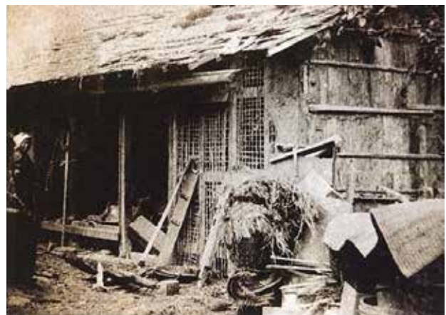
写真5 下流和食町被害状況