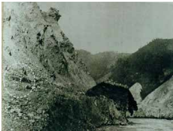
写真2 高磯山の崩壊地の様子（明治25年）

絵図の左側が下流、高磯山の崩壊場所は、那賀川が崩壊土砂で河道閉塞され下流には水がほとんど流れていない状況や上流はダムようになって洪水を貯めている様子が描かれている