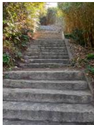
整備後の階段の様子