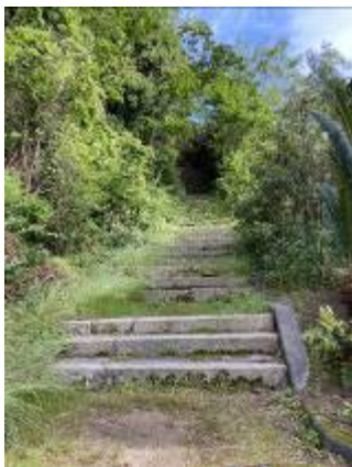
整備前の階段の様子