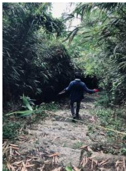
高原城址に続く整備前の階段