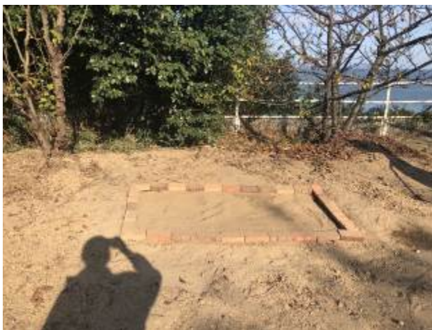
花壇設置後の様子

蔓延防止等重点措置が香川県に適用され、活動が制限されているため2月中旬に予定していた作製には取り掛かれていませんが、3月中の設置を目指しています。