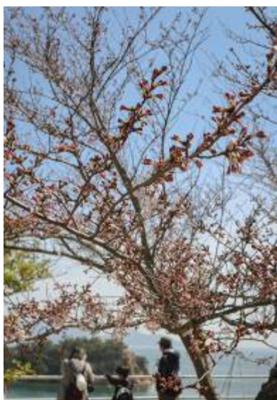
展望スポット 高原城址

高原城址再生プロジェクトは、地域住民との会話から生まれたもので、昨年度から始まりました。このプロジェクトの活動場所は、直島という瀬戸内海に浮かぶ小さな島にあります。私たち直島地域活性化プロジェクトは直島で和 cafe ぐうを経営しており、そのカフェの裏山に高原城址が位置しています。かつて、直島小学校の遠足や美しい景観で直島島民や観光客を魅了していた高原城址が、管理団体の高齢化によって荒廃していました。そこで、このプロジェクトでは、私たち学生の活動により、再び高原城址を人々が集まる賑わいのある場所へと再生することを目的としました。今年度の主な活動は景観整備と人々が集まる仕組み作りの2点でした。