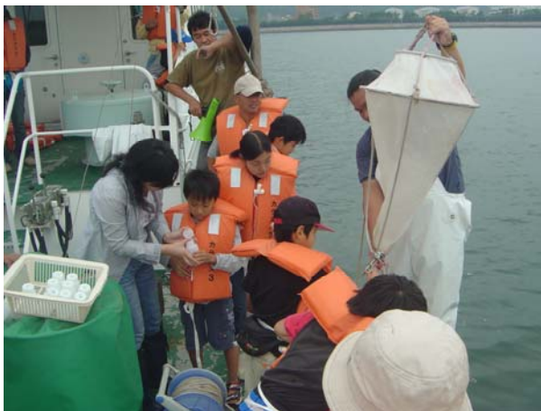
香川大学公開講座