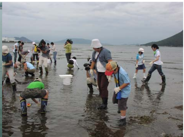
浜辺の自然・文化・歴史教室